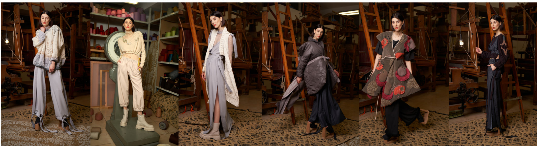
Wolno dotykać - zestawienie sylwetek