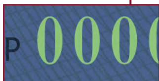
Numeracja typograficzna (świecąca na zielono)

jasnożółte widoczne także w świetle widzialnym