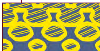
Farba transparentna (świecąca na żółto)